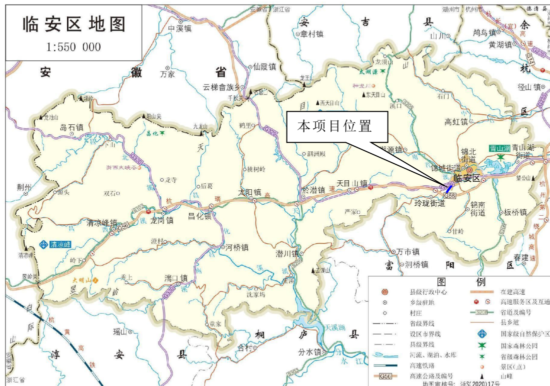
图 4-1 工程地理位置示意图

临安区玲珑科创园区及配套基础设施工程-玲珑1号地块综合开发项目(配套道路)配套 110kV 电力杆线迁改工程位于杭州市临安区玲珑街道,其地理位置示意图见图 4-1。